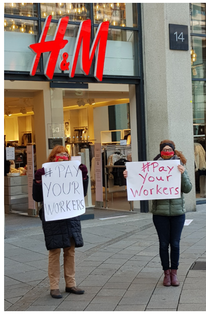
#payyourworkers-Aktion in Stuttgart

Einmal im Jahr treffen sich Aktivist*innen, Multiplikator*innen sowie Interessierte der Kampagne für Saubere Kleidung, informieren sich über die aktuellsten ARBEITSBEDINGUNGEN IN DER GLOBALEN MODEINDUSTRIE und probieren sich in verschiedenen Aktionsformen aus. Im Fokus stehen dabei die Fragen: Wie machen wir andere auf die desaströsen Arbeitsbedingungen von Textilarbeiter*innen aufmerksam? Was fordern wir von Modeunternehmen und Politiker*innen?